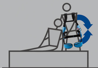
用於提供護理服務